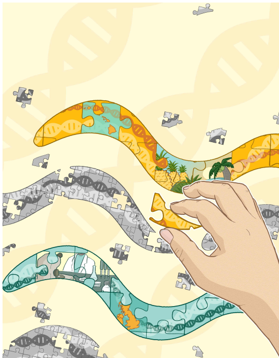
그림 설명: 유전체 이어붙이기는 흔히 퍼즐 맞추기로 비유된다. DNA 조각을 서로 비교해 겹치는 부분을 찾아 이어붙이는 것과 퍼즐 맞추는 일이 비슷하기 때문이다. 이 DNA 조각이 작으면(회색 퍼즐) 그만큼 더 많은 조각을 맞춰야 하고 조각이 제 위치를 찾기 어려울 때가 생기지만, DNA 조각이 크면(노란색, 초록색 퍼즐) 그만큼 쉽고 정확하게 유전체라는 커다란 퍼즐을 완성할 수 있는 셈이다. 본 연구는 큰 퍼즐로 쉽게 선충 유전체를 완성한 것이다. 손에 들고 있는 퍼즐 조각은 꼬마선충의 꼬리임과 동시에 염색체의 말단 즉 텔로미어 부분을 상징한다.

[붙임] 1. 연구결과 2. 용어설명 3. 그림설명 4. 연구진 이력사항