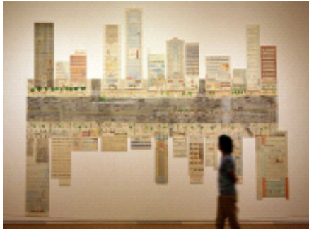
[강남대로고현학(Gangnamdaero Modernology)], 2010년 Ink and Watercolor, 400x500cm