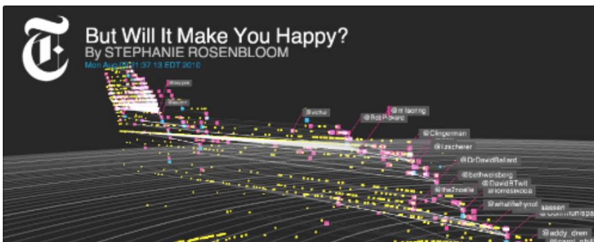
Project Cascade (2010 - 2011)