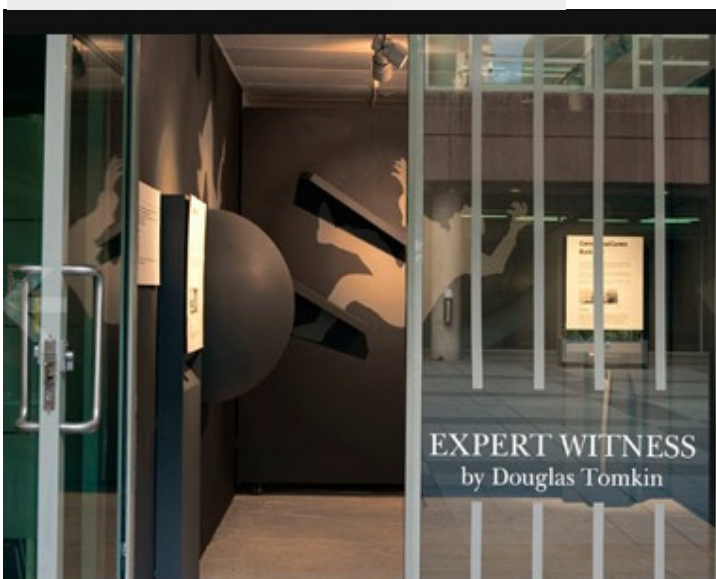
Expert Witness Exhibition