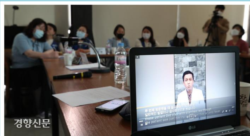
지난 13일 국제간호사의날을 기념해 민주노총 공공운수노조 의료연대본부가 개최한 '보건의료 노동자의 눈으로 보는 코로나19의 현실과 향후 과제' 좌담회에서 인도네시아의 한 의료인이 영상을 통해 자국 상황을 설명하고 있다.