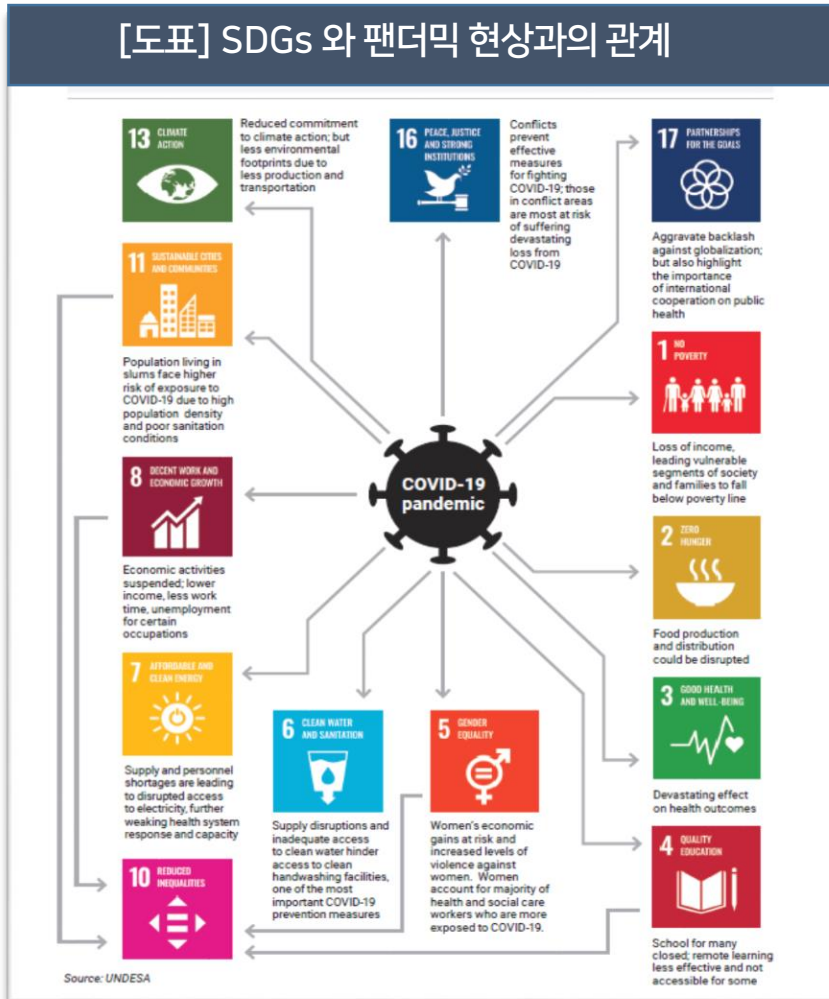
[도표] SDGs 와 팬더믹 현상과의 관계

선진국, 개도국 가릴 것 없는 팬더믹 현상, 빈곤 국가에 미치는 영향 더 위협적... 코로나19 팬더믹, 곧 SDGs 달성의 위기