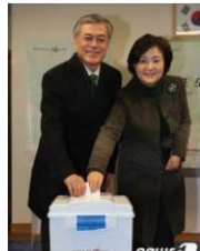
문재인 *혼신의 힘 다했...