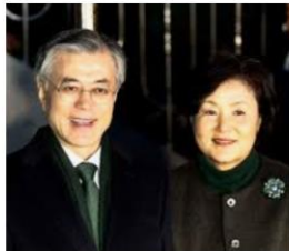
문재인 *진인사대천명...혼신의 힘 다... ejanews.co.kr