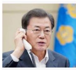
국민은 뒷전이고 중이 먼저인 문제... speconomy.com