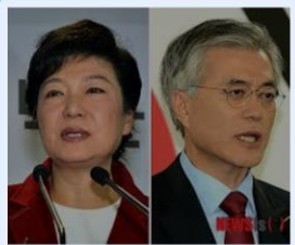
진인사대천명(盡人事待天命) - 중앙... news.joins.com