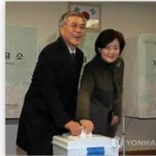
문재인 *혼신의 힘 다했다..진... yna.co.kr