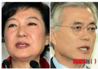
진인사대천명(盡人事待天命) - 중앙일보 news.joins.com