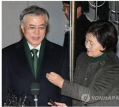
문재인 *혼신의 힘 다했다..진인사... yna.co.kr