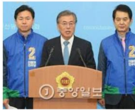
문재인 *진인사대천명...투표해 주십시오... news.joins.com